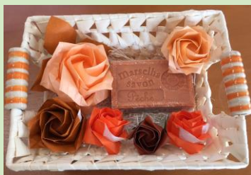
☆薔薇の折紙+輸入石鹸セット